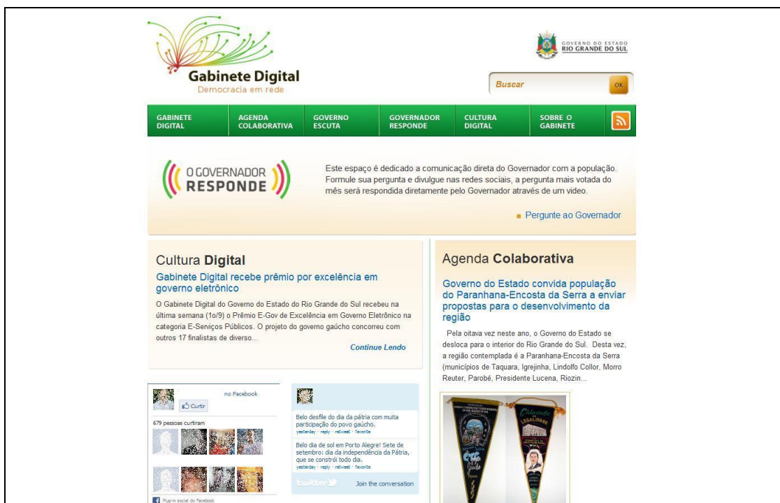
Figura 2 - Reprodução da página eletrônica do Gabinete Digital do Governo do Estado do Rio Grande do Sul (2011)