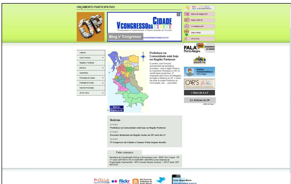
Figura 1 - Reprodução da página eletrônica do Orçamento Participativo de Porto Alegre (2011)