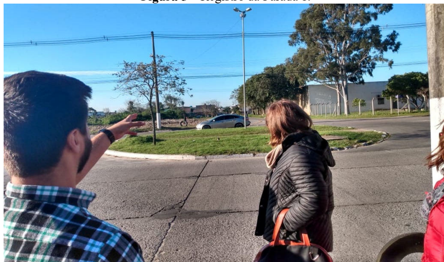
Figura 5 – Registro da Parada 1.

A primeira parada oficial do percurso ocorreu em frente a uma rótula localizada na Av. Bento Gonçalves (Figura 5). Neste local os participantes foram orientados a observarem a paisagem urbana ali disposta, em frente à rótula havia um “vazio urbano” que estava sendo aterrado com resíduos de construção civil e lixo doméstico, o que levou os participantes a refletirem sobre as possibilidades de futuras ocupações de tal espaço.