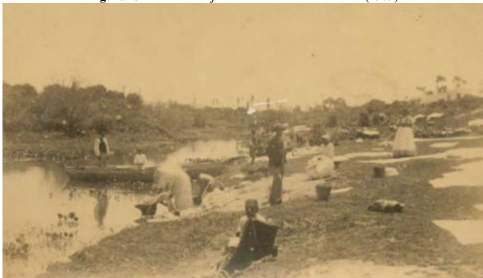
Figura 13 – Lavadeiras junto ao Arroio Santa Bárbara (1909).