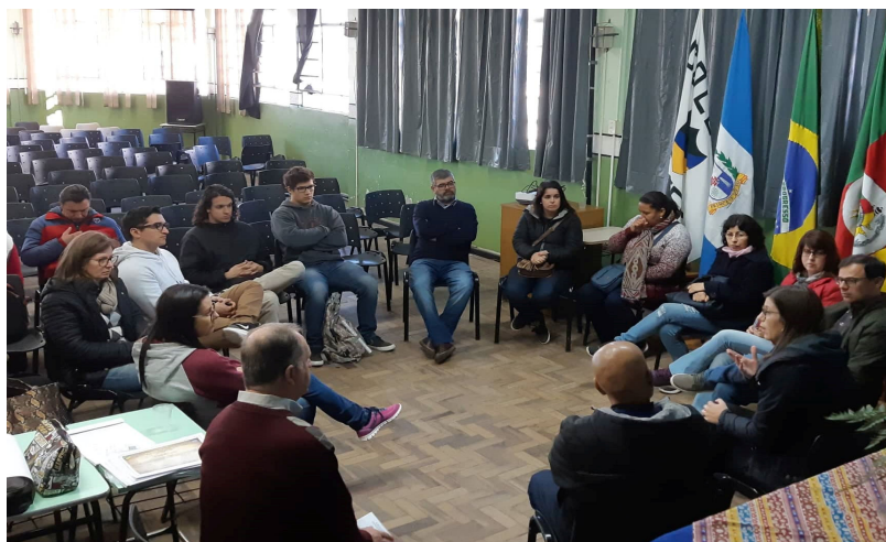
Figura 1 – Roda de conversa com os participantes da oficina.