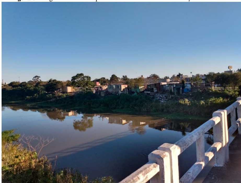
Figura 6 – Registro da vista da ponte localizada na Av. Bento Gonçalves - Parada 2.

Após algumas destas explanações em campo, a segunda parada ocorreu em uma ponte sobre o canal Santa Bárbara, que outrora foi em parte aterrado, canalizado e desviado o seu curso original do arroio. Localizada na Avenida Bento Gonçalves, nessa parada os participantes puderam ampliar suas noções acerca do processo de urbanização desordenado, sendo que as margens do canal apresentam muitas ocupações irregulares, com ligações de água e esgoto clandestinas, que são lançadas diretamente em suas águas, tornando visível na paisagem a sua contaminação (Figura 6).