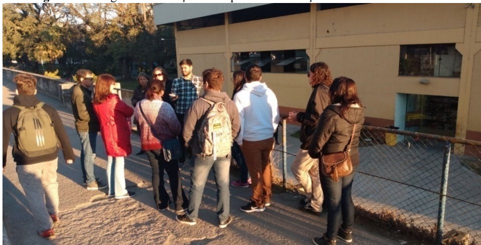
Figura 11 – Registro da situação do Pop Center e “Praça dos Enforcados” Parada 4.