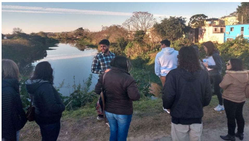
Figura 8 – Registro da vista da ponte localizada na Av. Duque de Caxias - Parada 3.