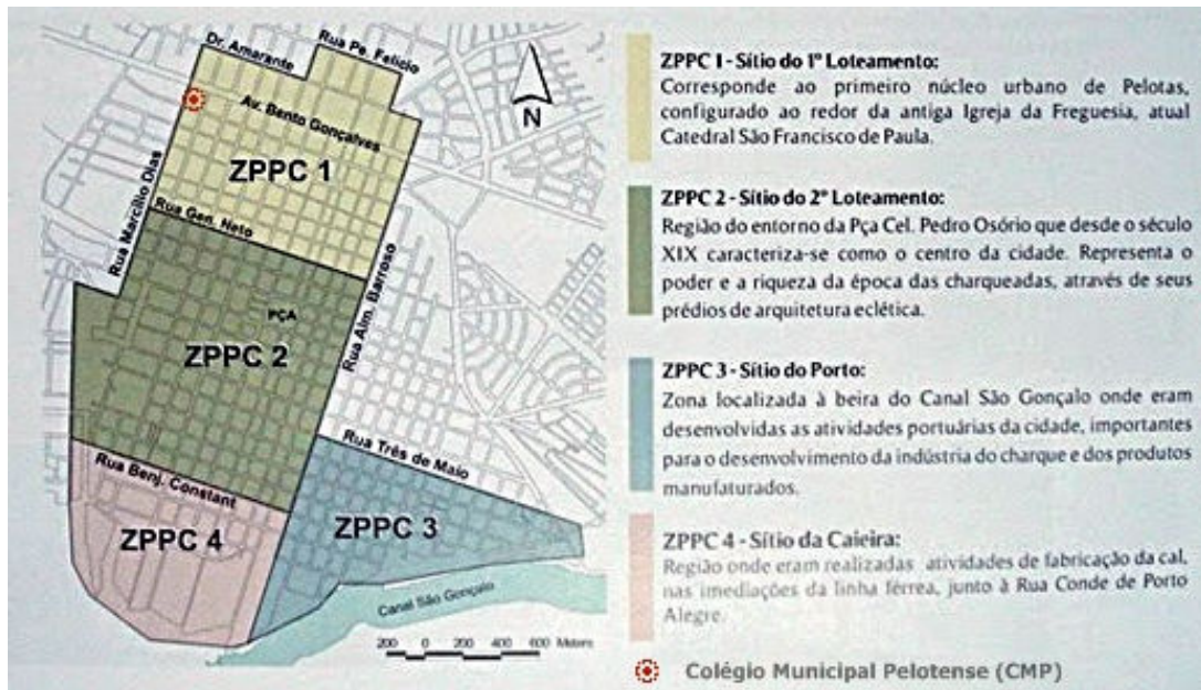
Figura 3 – Loteamentos da cidade e localização do Colégio Municipal Pelotense.

Fonte: Patrimônio Cultura de Pelotas, 2019 (adaptado pelos autores).