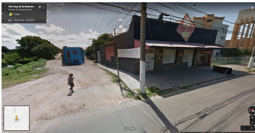
Figura 10 – Contraste entre as entradas das ocupações (à esquerda) e condomínio (canto à direita).

Fonte: Google Street View, 2019. Adaptado pelos autores.