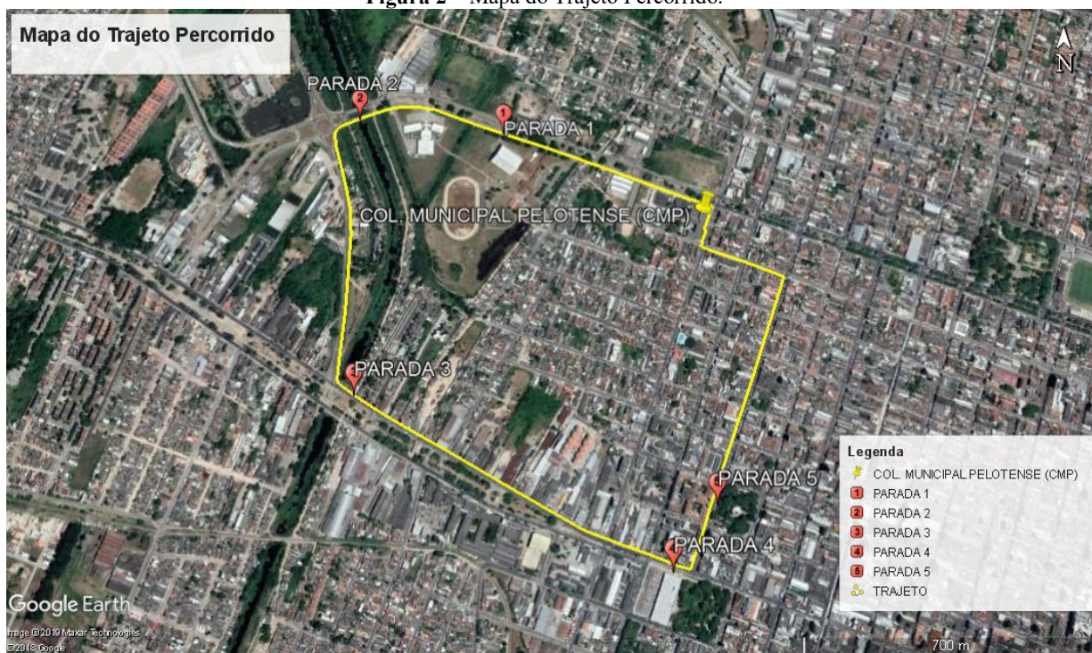
Figura 2 – Mapa do Trajeto Percorrido.