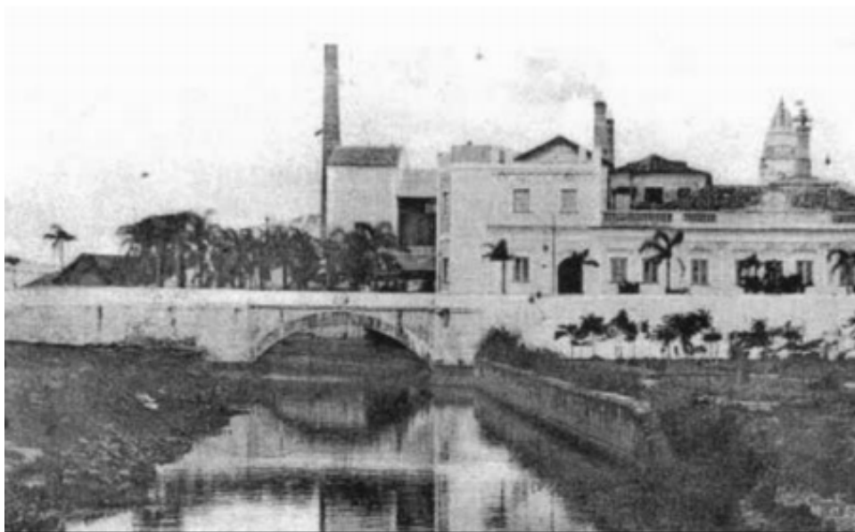
Figura 12 – Antiga ponte sobre o Arroio Santa Bárbara, na década de 1890.