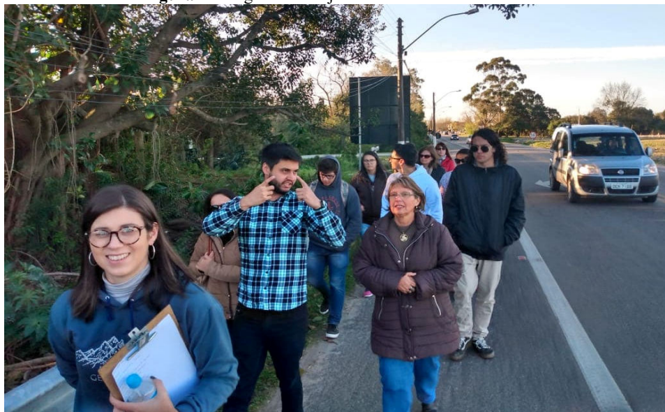
Figura 7 – Registro do trajeto no acostamento das vias.

Ao percorrer tal trajeto, durante a caminhada refletimos sobre o quão primordial é a etapa de preparação, para o sucesso da aula em campo. Pois, neste sentido, além de considerar o trajeto, a duração e os pontos de parada, o planejamento da aula, deve levar em consideração os problemas de tráfego que a cidade pode apresentar. Como se pode observar na Figura 7, grande parte do trajeto do campo foi executada no acostamento das vias, o que possibilitou aos participantes também refletir um pouco sobre mobilidade urbana.