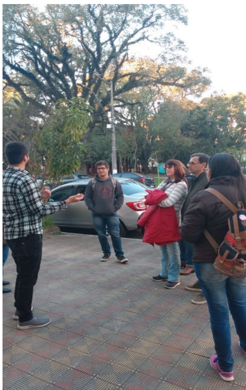
Figura 14 – Registro da Praça Piratinino de Almeida - Parada 5.

como patrimônio cultural, e imbuídos de sentimentos e considerações acerca dos lugares observados, conversamos sobre a importância de tal prática na resignificação dos olhares sobre o espaço urbano. Algo possível a partir de práticas educativas orientadas para tal fim, considerando o processo de ensino e aprendizagem, objetiva e subjetivamente.