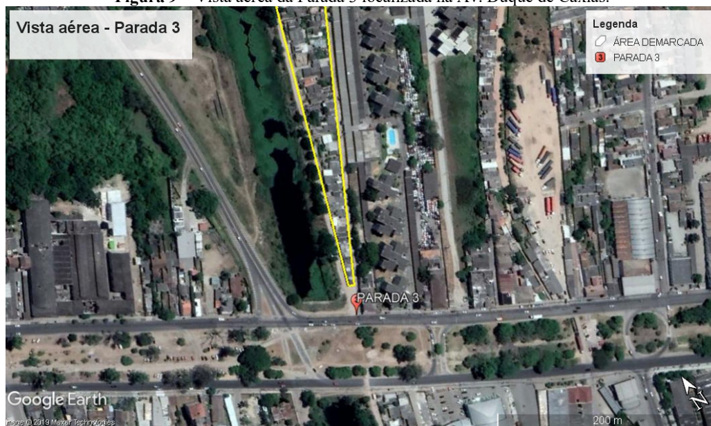
Figura 9 – Vista aérea da Parada 3 localizada na Av. Duque de Caxias.

Fonte: Google Earth, 2019. Adaptado pelos autores.