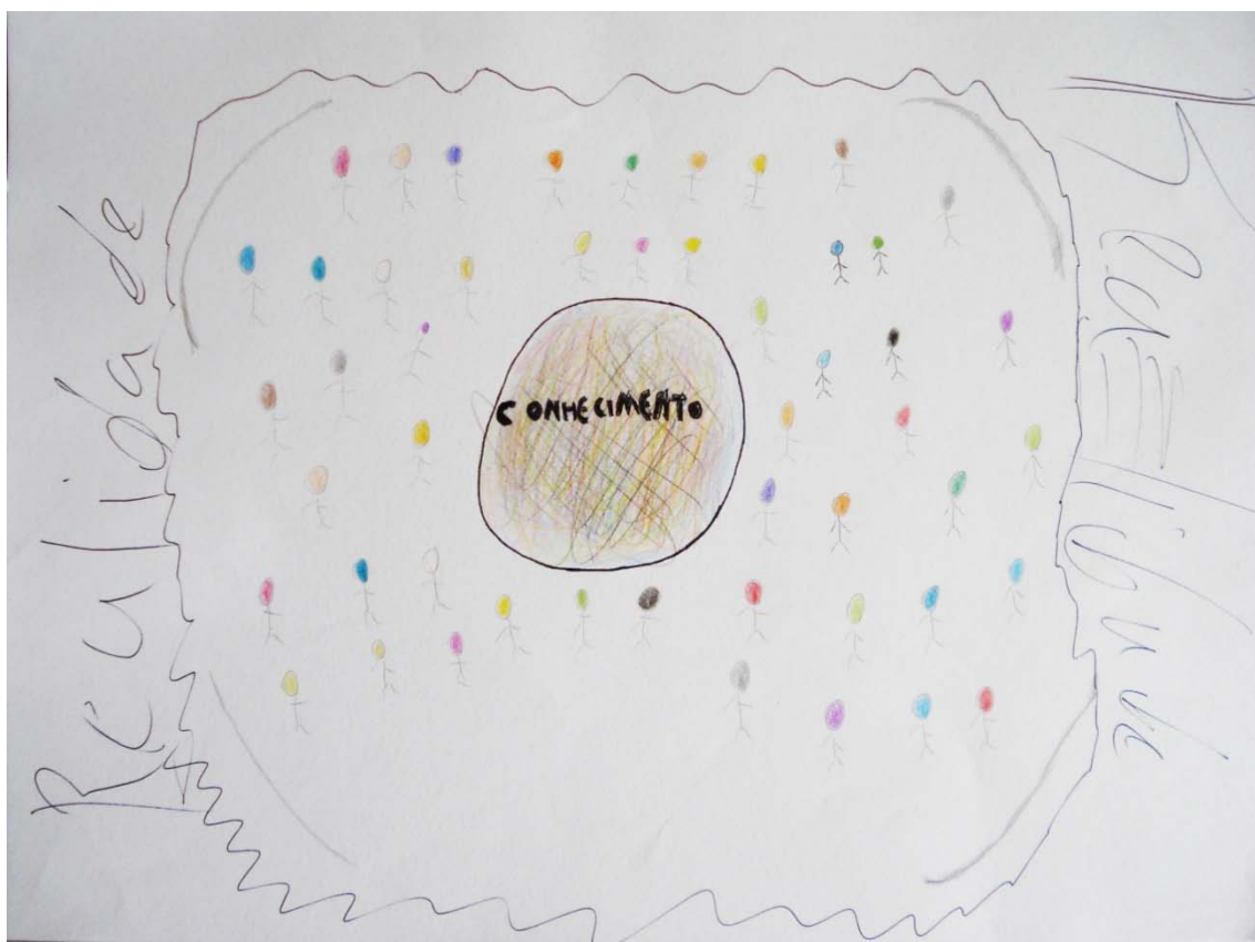
Figura 3 - Mapa mental elaborado por um dos participantes.

Data: 12/06/2014.