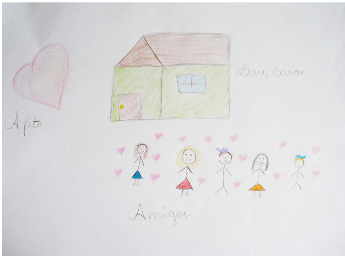
Figura 2 - Mapa mental elaborado por um dos participantes.

Fonte: Arquivo pessoal – Data: 13/06/2014.