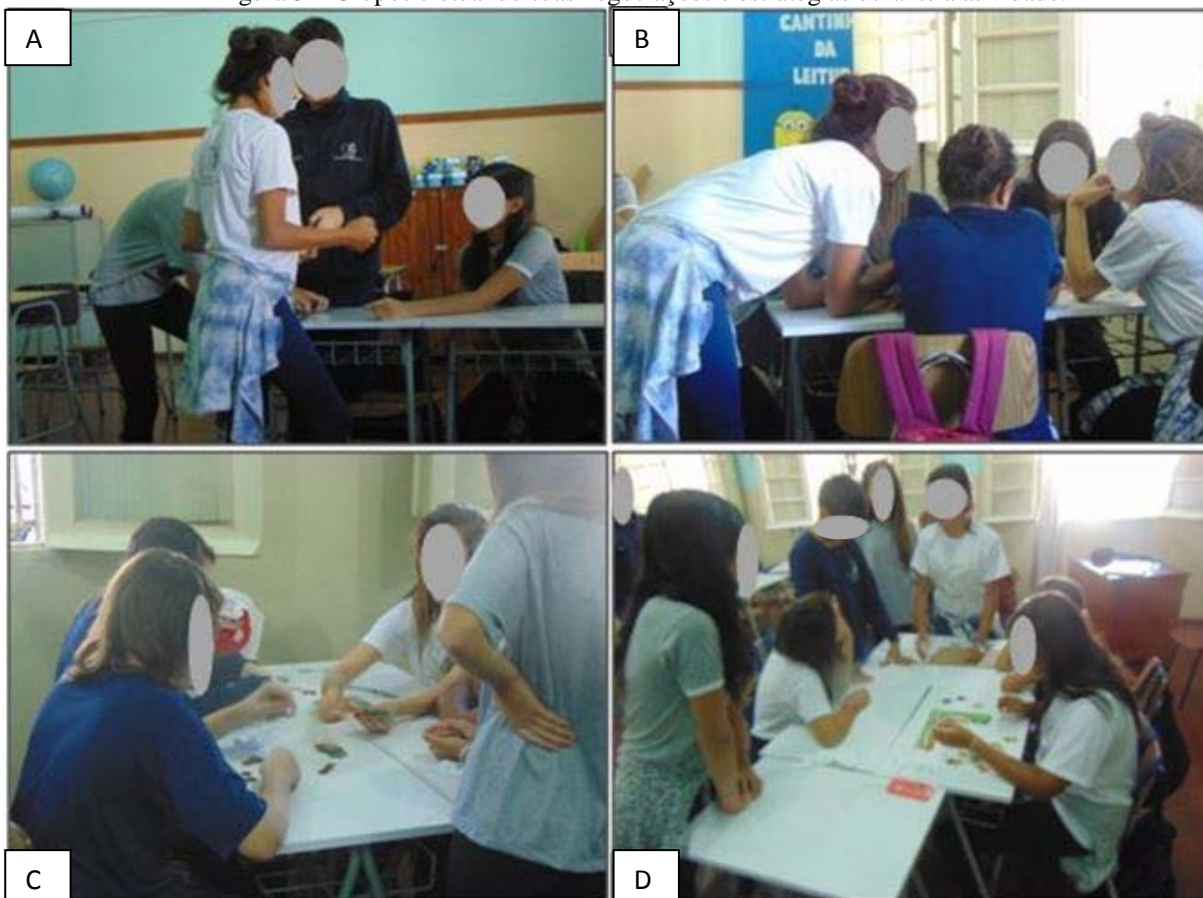
Figura 3 – Grupos efetuando suas negociações e estratégias durante a atividade.

A Figura 3 A, B, C e D traz alguns registros efetuados no momento das atividades, decisões e negociações entre os grupos.