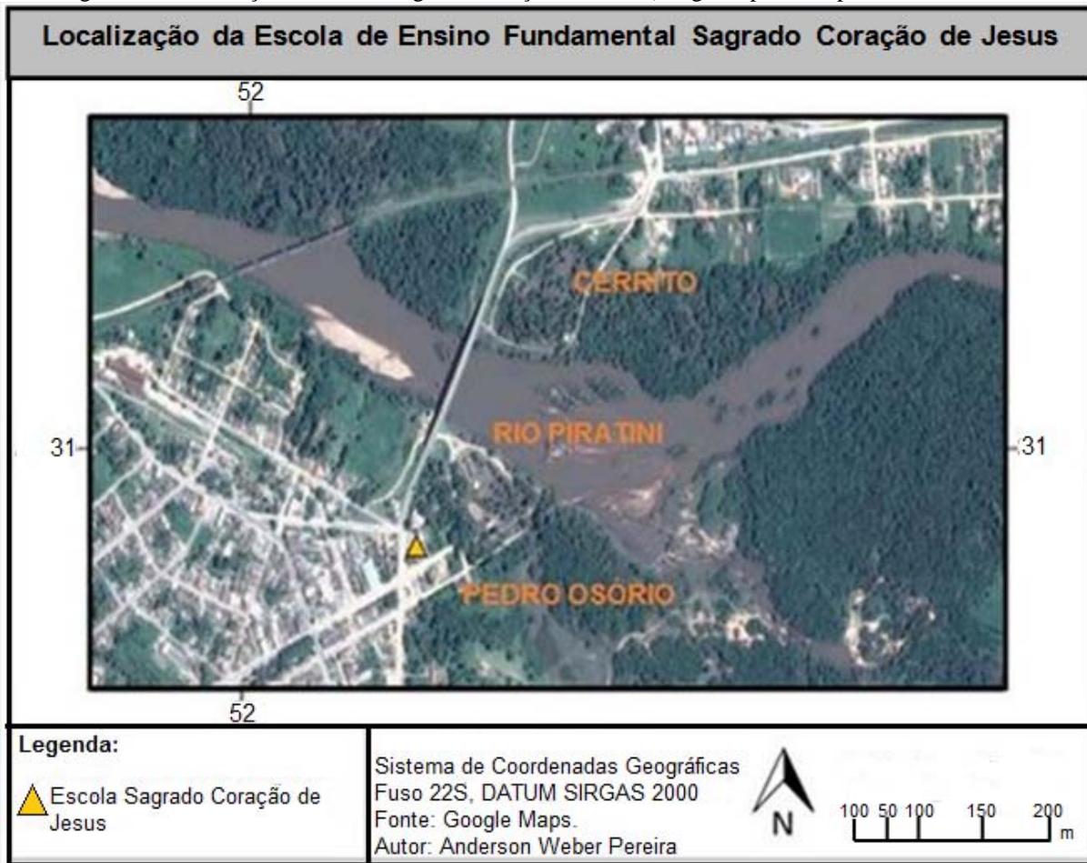
Figura 2 – Localização da Escola Sagrado Coração de Jesus (imagem apresenta parte de ambas às cidades).