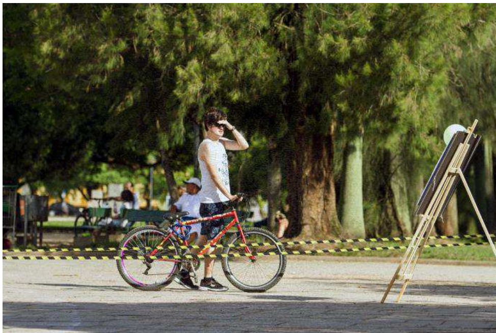
Figura 5 - Simulação de cercamento do Parque da Redenção, destinado ao empreendimento privado.