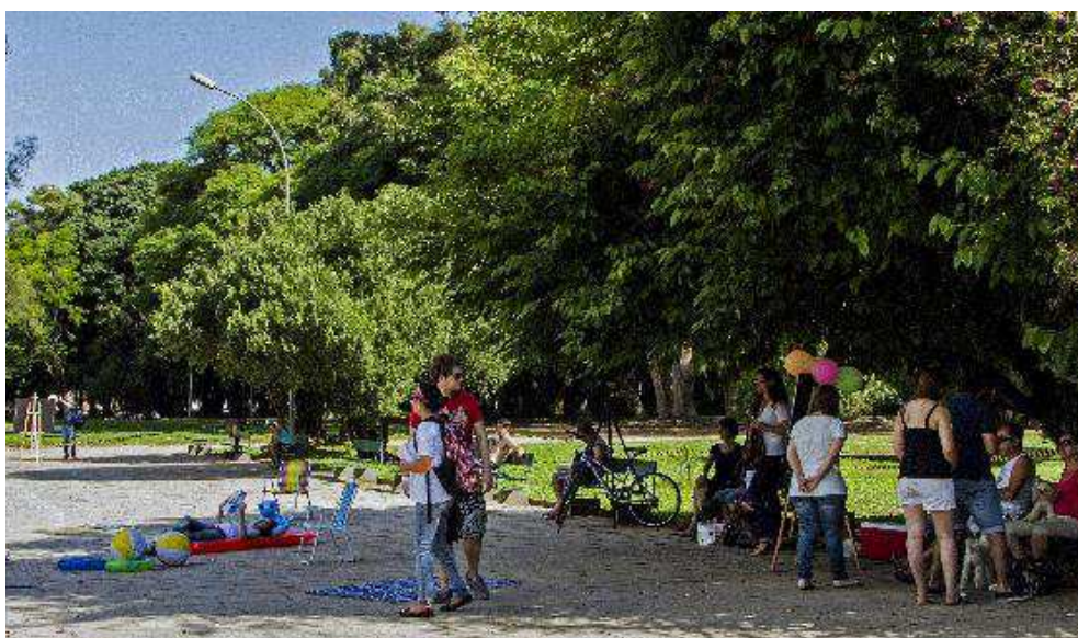
Figura 4 - Simulação de cercamento do Parque da Redenção, destinado ao empreendimento privado.

Fonte: Pesquisador do “Ateliê da Paisagem” (08/11/2014).