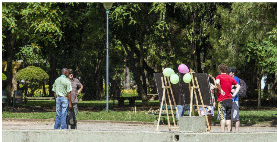
Figura 2 - Visualização dos cartazes de simulação do cercamento do Parque da Redenção, destinado ao empreendimento privado.