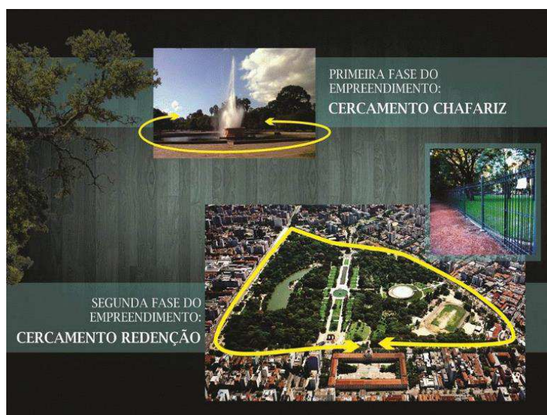
Figura 3 - Anúncio fictício de cercamento do Parque da Redenção, destinado ao empreendimento privado.