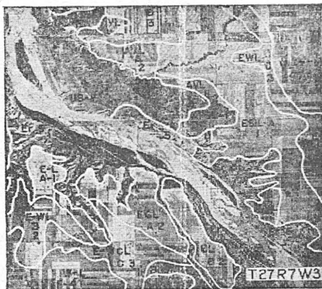
Ilustração n.º 3

Com o auxílio destes mapas de solos são designadas as áreas a serem cultivadas e identifica-se, ainda pela fotogrametria, as propriedades, convidando seus donos para ensinância dos métodos mais modernos de plantação. A distribuição de sementes é feita levando em consideração a constituição do solo em cada região, distribuindo-se os corretivos necessários.