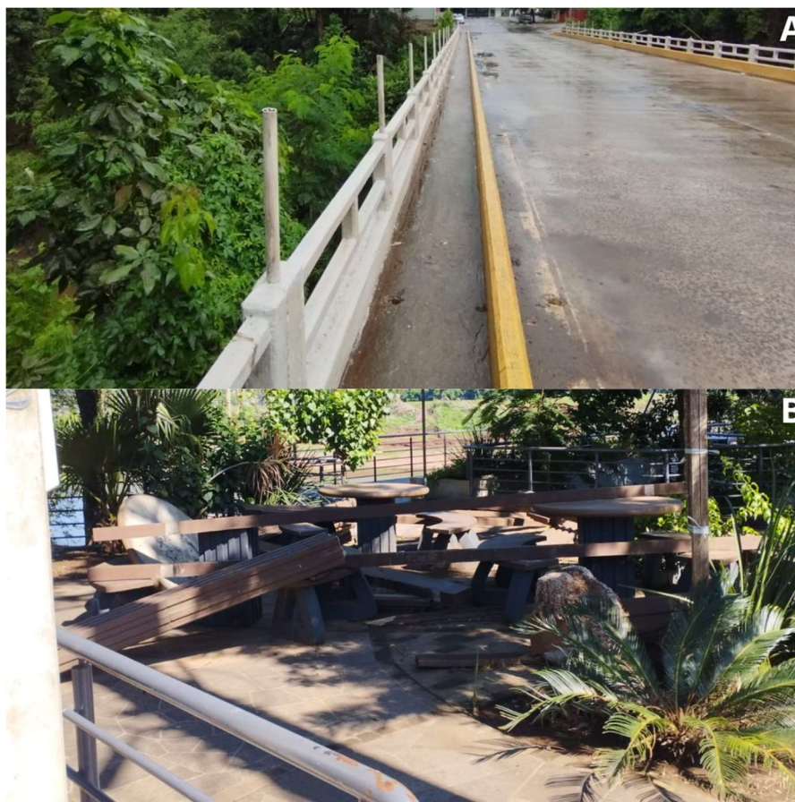
Figura 12 - Ponte sobre o arroio Conventos Vermelhos e Praça do Parque Náutico (pontos 9 e 10).

A última imagem (Figura 12) mostra dois equipamentos públicos de uso coletivo. Primeiro a ponte localizada na região central da cidade que cruza o arroio Conventos Vermelhos (ponto 9). Segundo a praça do parque náutico (ponto 10). Na ponte é possível verificar que o guarda-corpo ainda não tem a grade superior de proteção, que é fundamental para evitar acidentes ou outros eventos relacionados com a segurança dos pedestres. Por fim, na praça do parque náutico verifica-se que bancos e mesas permanecem quebrados, impossibilitando que as pessoas usufruam deste espaço público adequadamente.