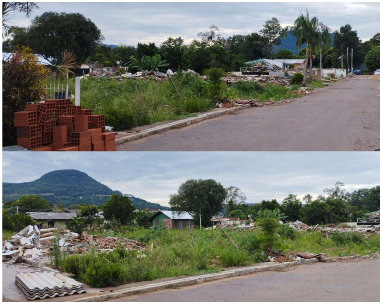
Figura 8 - Paisagem da Rua Cândido Giongo, no bairro Centro (ponto 6).

resistiram aos impactos das águas. Todas elas foram atingidas e ficaram submersas a uma profundidade superior a 6 metros, com exceção de apenas uma (entre 0 e 3 metros).