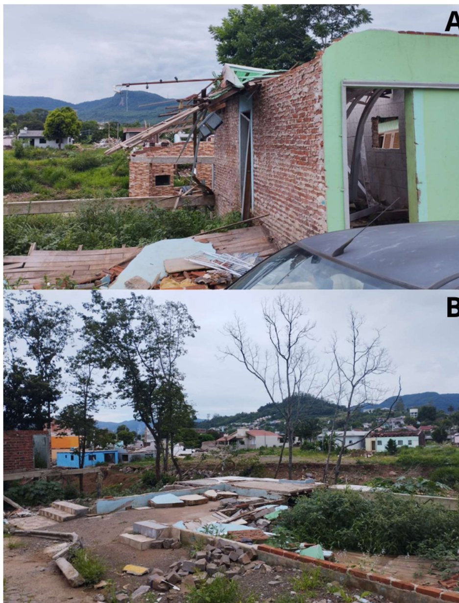
Figura 7 - Escombros e partes de residências destruídas na Travessa Berger (ponto 3)