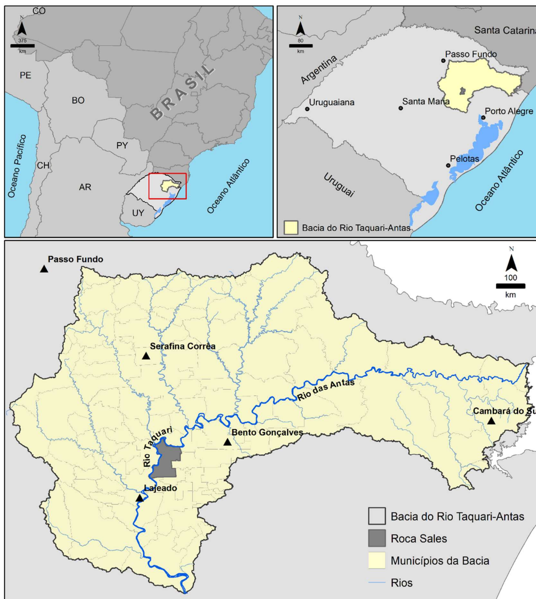
Figura 1 - Localização da Bacia Hidrográfica do Rio Taquari-Antas e município de Roca Sales, Rio Grande do Sul.

Fonte: SEMA, RS (2020); IBGE, 2022; 2023. Elaboração: o autor, 2024