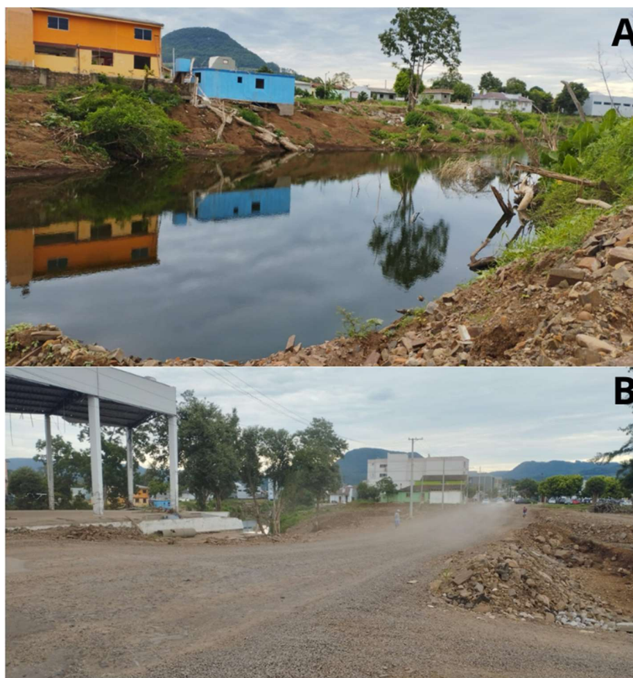
Figura 10 - Trecho represado do Arroio Sete de Setembro e Av. General Daltro Filho (pontos 4 e 5)