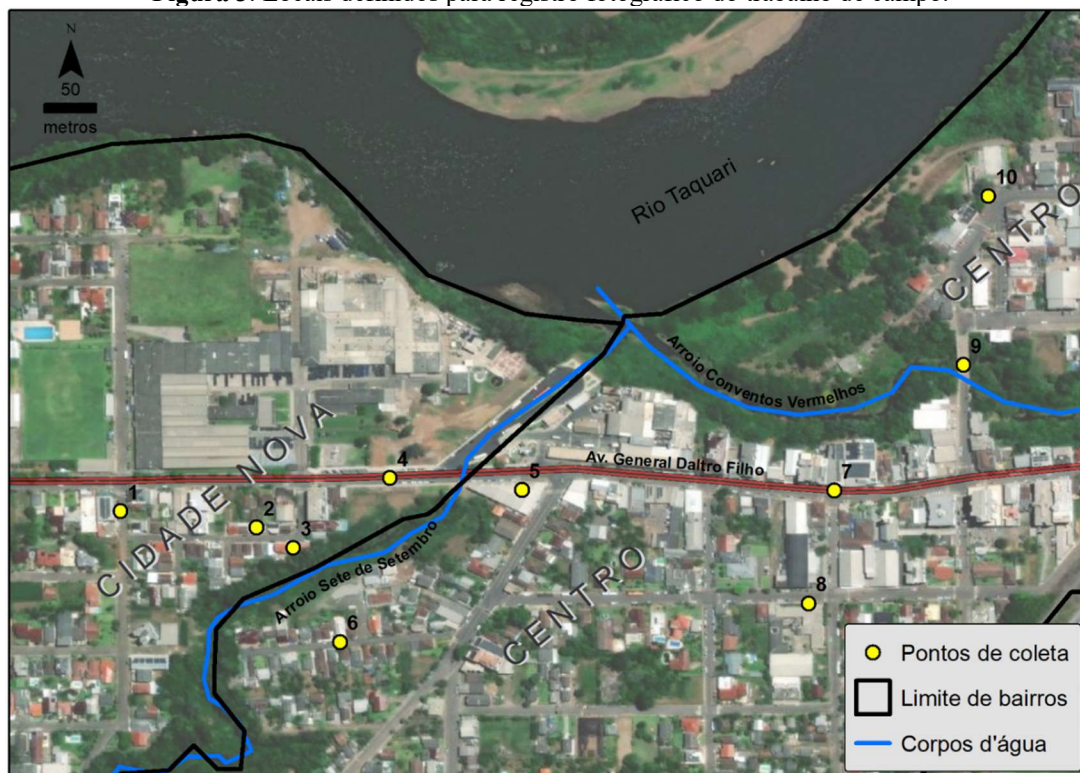
Figura 3. Locais definidos para registro fotográfico do trabalho de campo.