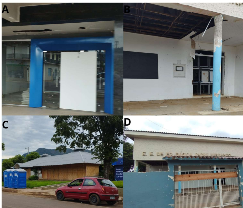
Figura 11 - Fachadas de equipamentos comerciais e educacionais (pontos 7 e 8)

Do ponto de vista de edificações de outros usos que não residenciais, há três que ainda não voltaram a operar nos prédios antes ocupados. A Figura 11 mostra os prédios da Caixa Econômica Federal (CEF), Banco do Estado do Rio Grande do Sul (Banrisul) e a Escola Estadual de Educação Básica Padre Fernando.