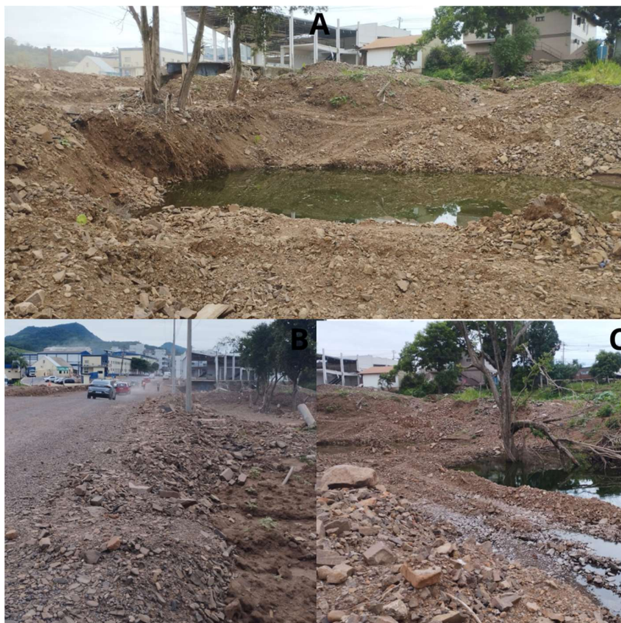
Figura 9 - Danos estruturais na canalização do Arroio Sete de Setembro e na Av. General Daltro Filho (ponto 4).

e até mesmo o curso do arroio, que acabou ficando represado sem conseguir escoar novamente para o rio Taquari. Abaixo, as figuras 9 e 10 mostram como estava o local no dia 05 de fevereiro de 2024.