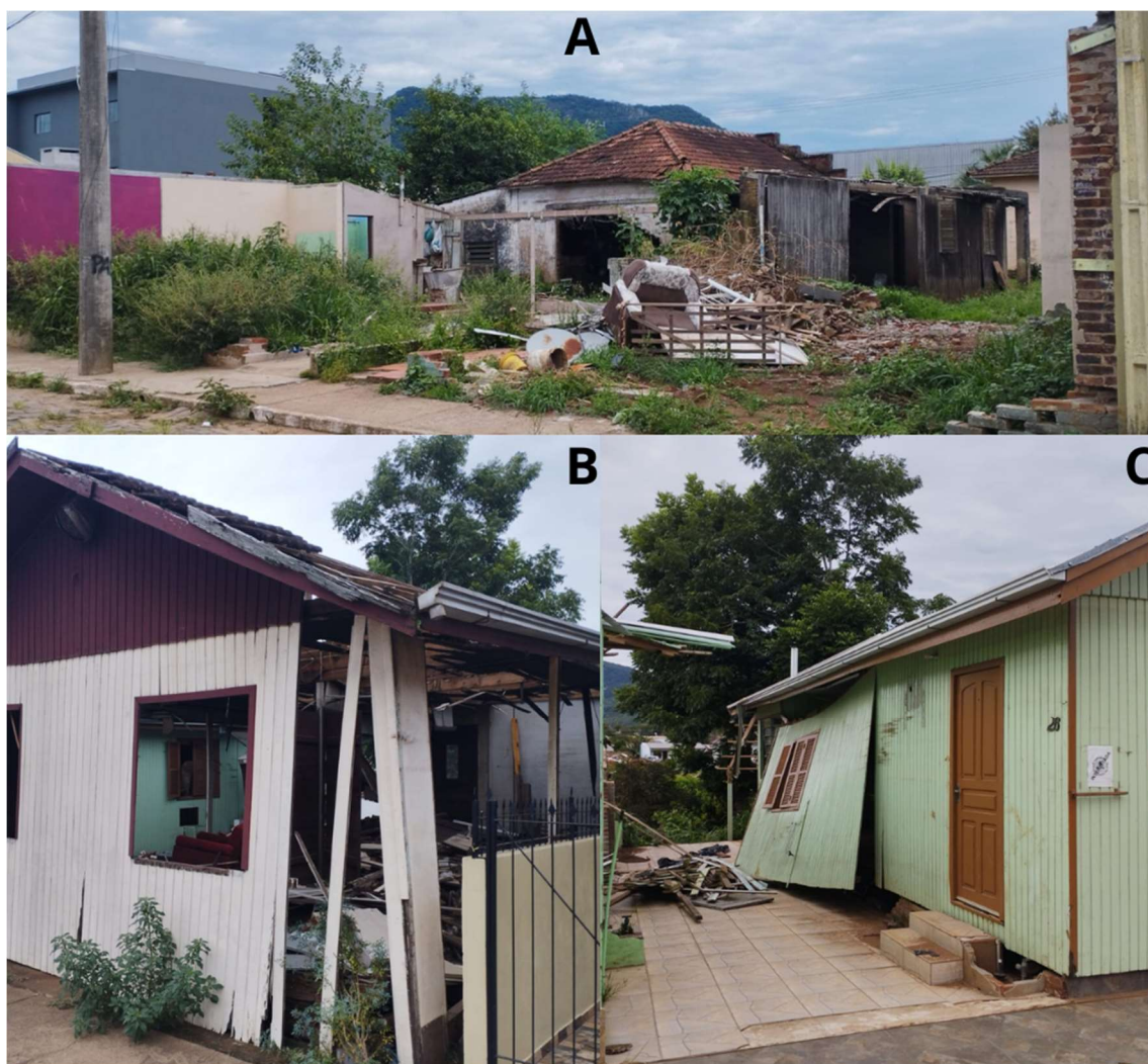
Figura 6 - Escombros e casas destruídas na Travessa Berger (ponto 2).