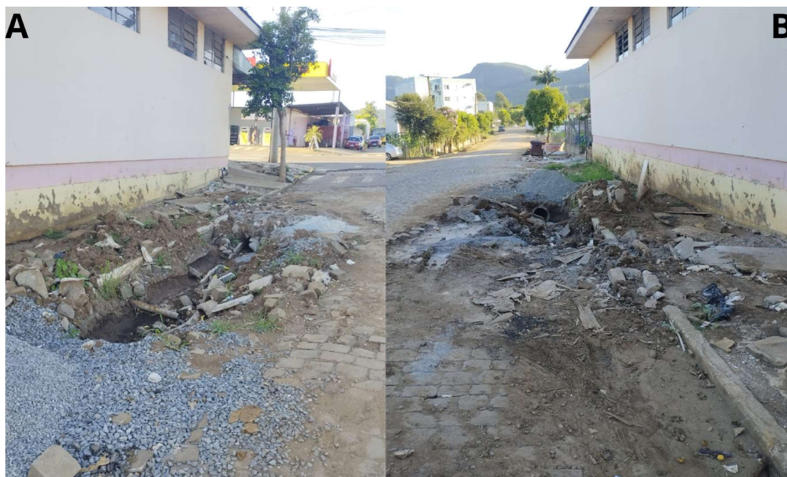
Figura 5 - Via e rede de drenagem urbana danificadas na Rua 31 de Outubro, bairro Cidade Nova (ponto 1).

fotográficos muitos destes problemas foram resolvidos pela prefeitura, porém cabe destacar a ordem de prioridades e a eficiência na execução dos serviços.