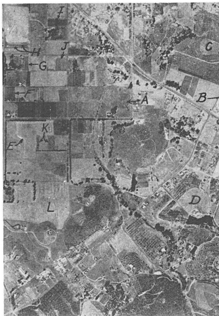
Fig. 1 — A importância do padrão na foto-interpretação de culturas agrícolas está bem ilustrada nesta foto aérea vertical de uma área da Califórnia, na escala de 1:10.000. Notem que o padrão formado pelas árvores individuais nos pomares é linear nas planícies da região (A e B), mas arqueada ou ondulada nas zonas montanhosas (C e D). Semelhantemente, o padrão formado pelo campo é retangular nas planícies (porção superior à esquerda da foto) onde estradas são retas, mas irregular na zona montanhosa (porção inferior à direita da foto) onde estradas sinuosas e mudanças abruptas na topografia freqüentemente delimitam os limites dos campos. Finalmente, notem que dentro dos campos individuais o padrão de cultivo (E e F) e o padrão da colheita formado por medas de feno (G e H) são guias adicionais para os tipos de culturas e seus estados de desenvolvimento.

A primeira vista, as pastagens na visão vertical muitas vezes parecem como campos de feno. Entretanto, a presença de animais domésticos, árvores dispersas, rastros de animais domésticos, sítios duramente pisados ao redor do bebedouro e de salgadura ou perto da entrada para os campos, e a proximidade de celeiros e barracões tornam as pastagens fáceis de reconhecer. Elas geralmente aparecem em tonalidades cinzento claro através do ano. Marcas de tonalidades mais escuras ou mais claras podem aparecer devido ao uso desigual, joios de coloração clara ou flores de plantas de pasto, e excrementos de animais domésticos.