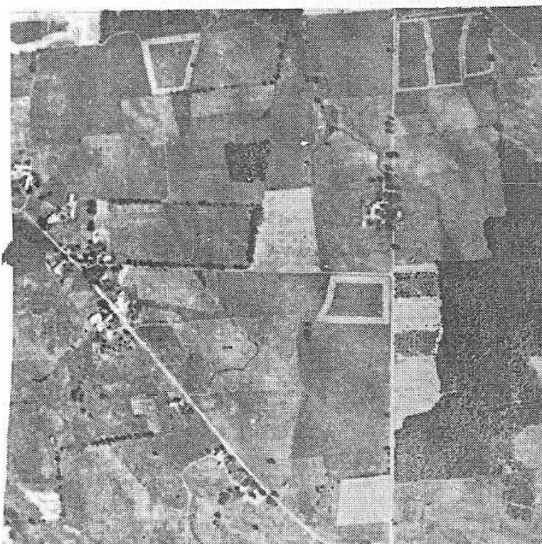
Fig. 6 — Esta área no "Corn Belt" Oriental em Illinois. Ilustra os padrões típicos das áreas agrícolas. Neste quadro as culturas estão prontas para a colheita. As áreas de tonalidade escura são campos de milho; as áreas cinzento claro são campos de pasto. Notem o cuidadoso desenho no campo com típicas linhas de bordas nítidas de intensivo uso da terra nessa produtiva área de terras baixas. Fins de Setembro.