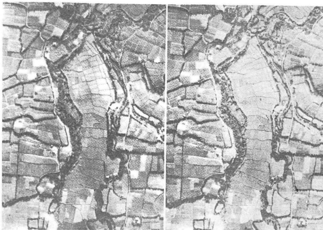
Fig. 3 — Estereograma de Tokuno, no Pacífico Tropical, ilustrando o efeito da situação topográfica na localização de colheitas. Notem que somente culturas de banhado (principalmente arroz e inhame) cresceram nos fundos dos vales pobremente drenados, e somente culturas de terra seca (principalmente cana-de-açúcar, batatas-doce e feijões cresceram nos barrancos bem drenados.