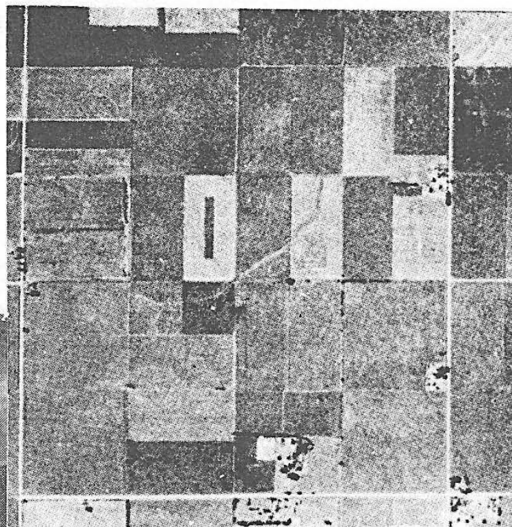
Fig. 5 — As áreas escuras rodeadas pelas faixas brancas são campos onde o feno está sendo ceifado. Foto tirada em Junho.