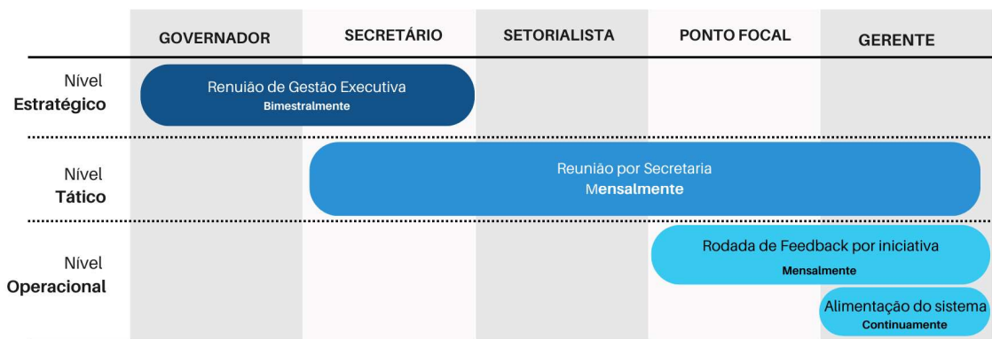
Figura 2 – Atores do contrato de gestão e respectivas rodadas de monitoramento (até 2022)