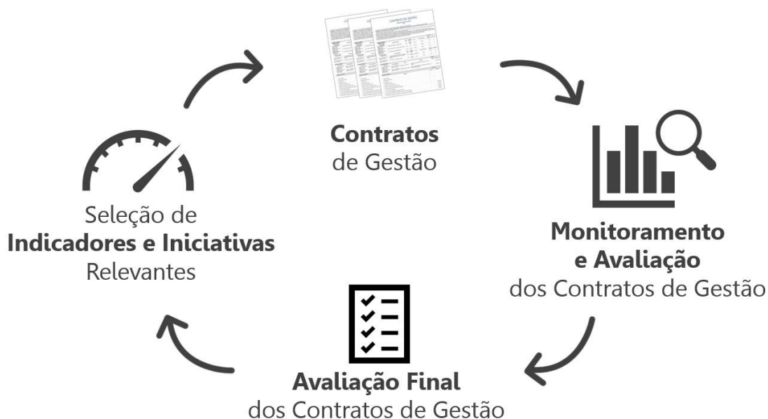
Figura 4 – Ciclo anual do contrato de gestão