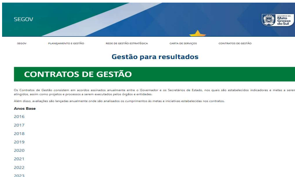
Figura 5 – Página de disponibilização para a sociedade dos contratos firmados entre o governador e as secretarias, com os principais projetos, ações (entregas), indicadores e metas no período de 2016 até 2023.