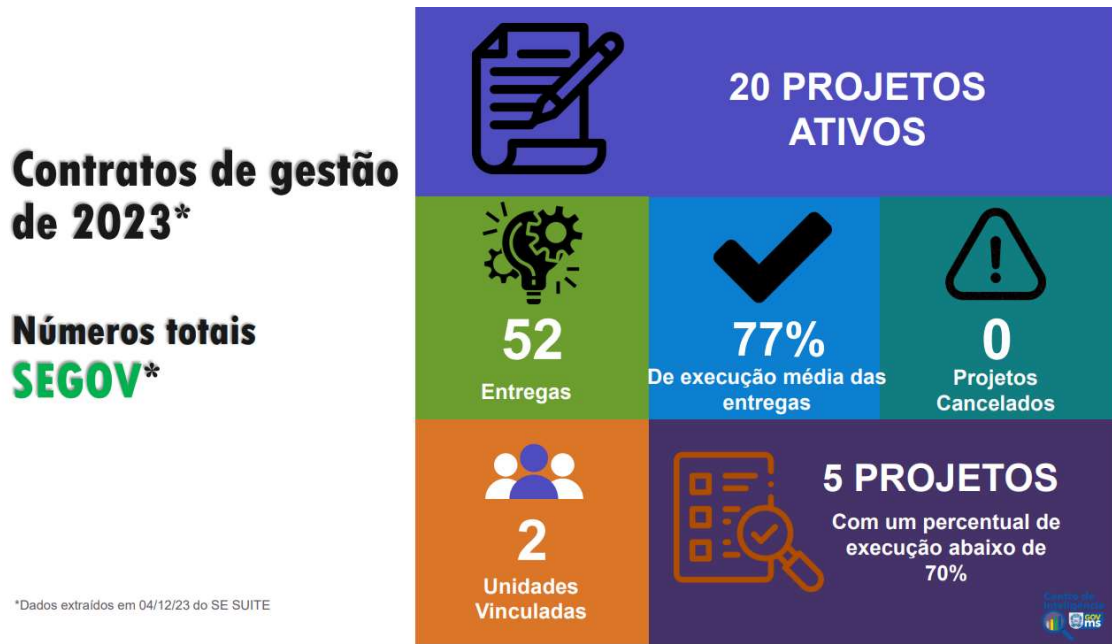
Figura 8 – Fragmento do relatório SMART